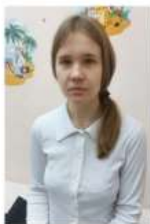
Карина Январь 2008 г.р.