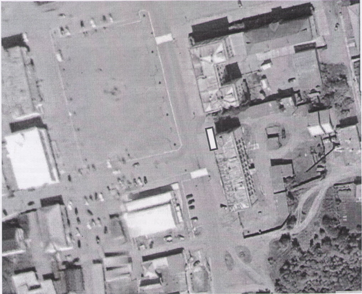
Схема размещения сельскохозяйственной ярмарки на территории с.Шатрово (ул.Орловская, 1а)

Приложение к Порядку организации и проведения постоянно действующей сельскохозяйственной ярмарки в селе Шатрово